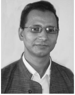
● हिरामणि दुःखी ●

एमसीसी परियोजना नेपालको हितमा नभएपछि नेकपा (क्रान्तिकारी माओवादी) विगत तीन वर्षदेखि एकल रूपमा, कहिले २२ दलीय गठबन्धन र विगत एक वर्षदेखि छ दल र दुई मोर्चाको संयुक्त आयोजनामा खारेज गर्नुपर्ने माग राखेर निरन्तर सडकमा आन्दोलन गर्दै गयो । यतिखेर गत पुस २६ गतेदेखि लगातार सडकमा एमसीसी विरुद्धमा आन्दोलन चलेपछि संसदमा रहेका माओवादी केन्द्र र एकीकृत समाजवादीले जनताको आन्दोलनलाई विथोलेर आफूहरूले सडक कब्जा गर्न षड्यन्त्र गरे । उनीहरूले एकातिर संसदमा संसोधन विना पारित हुन सक्दैन भन्दै सरकारको नेतृत्व गरेको काङ्ग्रेसलाई दवाव दिइरहे र अर्कातिर एमसीसी विरुद्धको आन्दोलन संसद बाहिर रहेका क्रान्तिकारी कम्युनिस्टहरूको कब्जामा नजावस् भनेर सडक कब्जा गर्न आफ्नो पार्टी अन्तरगतका युवा विद्यार्थीहरूलाई सडकमा आन्दोलन गर्न लगाए । यसो गर्दा सडक पनि आफ्नो कब्जामा रहने, सडकको दवावले काङ्ग्रेसलाई भुक्न लगायौं भन्दै संसोधन सरहको भनेर 'ब्याख्यात्मक प्रस्ताव' पारित गर्न सफल भयौं भनेर जनतामा ठूलो भ्रम छर्ने रणनीति अपनाए । यसरी पहिलो, एमसीसी सजिलै पास गरेर एकातिर अमेरिकालाई खुसी पार्न, दोस्रो विगतदेखि संसोधन विना पास गर्न सकिदैन भन्दै आएकोमा सेफल्याण्ड पनि सहजै हुने र तेस्रो कुनै हालतमा पास गर्नु हुँदैन भन्ने आआफ्नै पार्टीका कार्यकर्ता र आम जनतालाई आखिरमा कुनै न कुनै माध्यमबाट संसोधन सहित पास गर्न त सफल भयौं नि भनेर भ्रम छर्ने सहज पनि हुने, एउटै मट्याङ्गाले तीन वटा शिकार गर्न सफल भए । सारमा साम्राज्यवाद सामू घुँडा टेकेर मालिक भक्ति देखाउँदै सत्तामा टिकिरहने दाउपेचलाई सफल तुल्याए ।