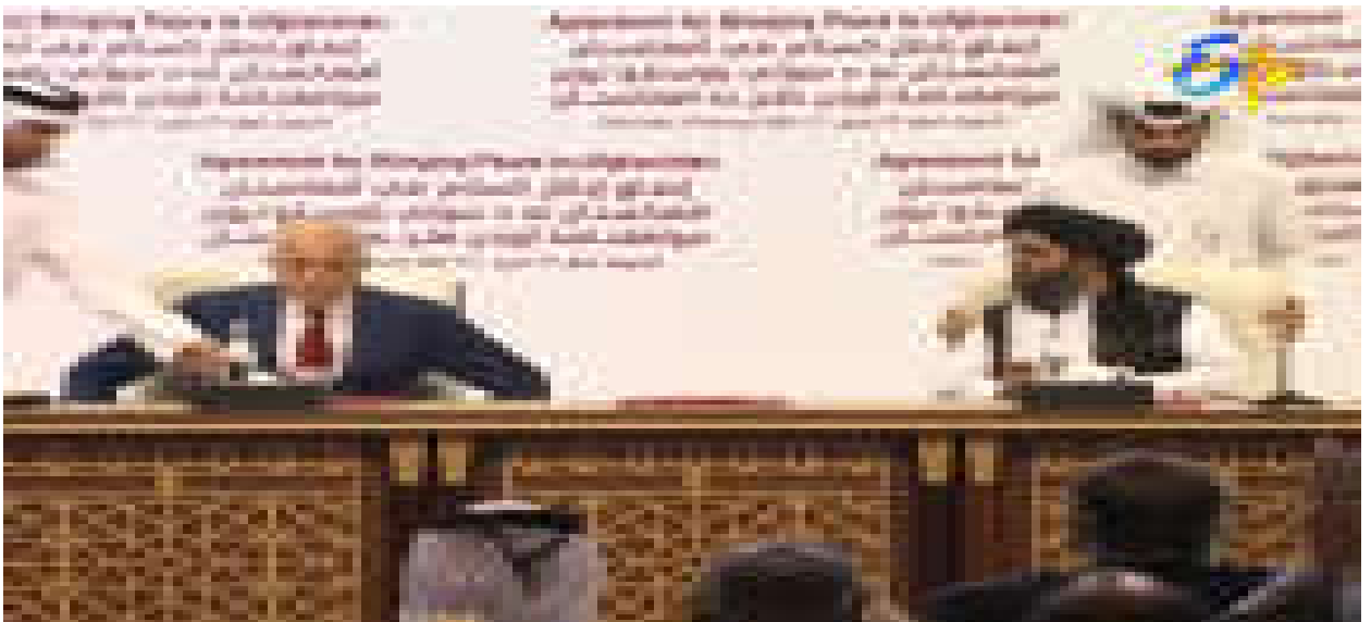
ఆప్షనిస్టాన్లో శాంతి ఒప్పందంపై సంతకాలు చేస్తున్న అమెరికా తాలీబాన్ ప్రతినిధులు