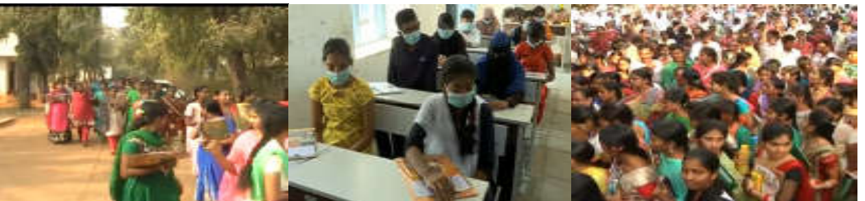
పరీక్షలు రాయడానికి వెళుతున్న విద్యార్థినులు