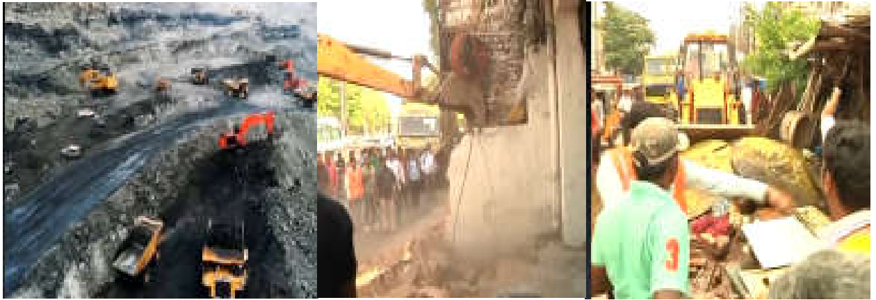
పర్యావరణాన్ని నాశనం చేస్తున్న గనుల త్రవ్వకాలు నోటీసులివ్వకుండానే ఇండ్లను కూల్చివేస్తున్న జీహెచ్ఎమ్సి అధికారులు