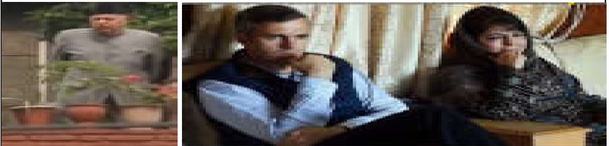
కశ్మీర్ మాజీ ముఖ్యమంత్రులను గృహ నిర్బంధంలో బంధించిన మోడీ ప్రభుత్వం