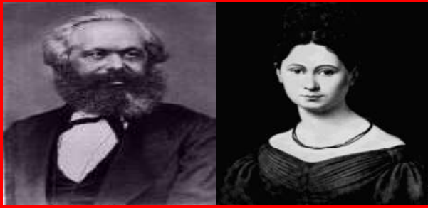
కారల్ మార్ష్, జెన్నీ మార్ష్

జస్టిస్' ఆహ్వానం మేరకు అందులో చేరారు. దాని పునర్వ్యవస్థీకరణకూ, కార్మికవర్గ పార్టీ స్థాపనకు ఎంతో కృషి చేశారు. సరికొత్త దృక్పథానికీ, విజ్ఞానానికీ అనుగుణంగా కేంద్రీకృత ప్రజాస్వామిక నిర్మాణ సూత్రాలను రూపొందించారు. దానిని కమ్యూనిస్టు లీగ్ గా ప్రతిపాదించడంతో పాటు "ప్రపంచ కార్మికులారా, ఏకంకండి" అనే అంతర్జాతీయ స్వభావంతో కూడిన నినాదాన్నిచ్చారు. 1847 జూన్ లో లండన్ లో కమ్యూనిస్టు లీగ్ ప్రథమ మహాసభ జరిగింది. కానీ మార్ష్ తిండికి కూడా లేని ఆర్థిక ఇబ్బందుల వలన హాజరు కాలేదు. అయితే పేరు, నినాదం ఆమోదం పొంది ఒక కార్మికవర్గ పార్టీ ఏర్పాటుకు వునాదులు పడ్డాయి. అదే సంవత్సరం నవంబర్ 29న ప్రారంభమైన అంతర్జాతీయ మహాసభ