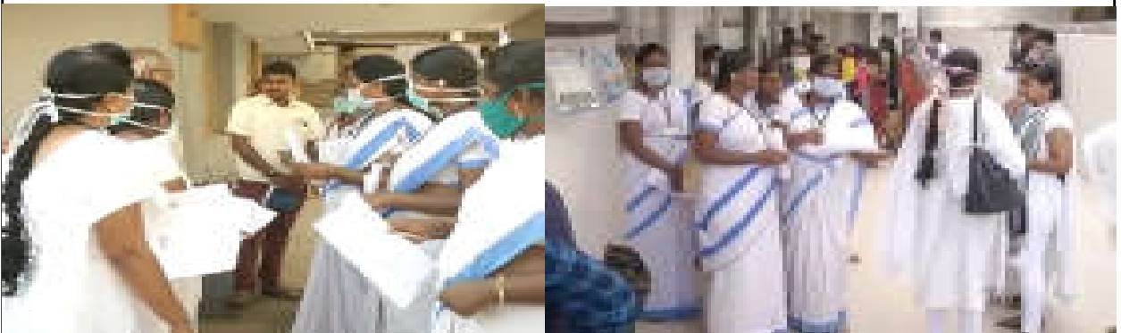
కరోణ బాధితులకు వైద్య సేవలు అందిస్తున్న ఆశ వర్కర్స్