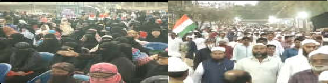
ఎన్ఆర్సీకి వ్యతిరేకంగా గళమెత్తిన ముస్లీంలు