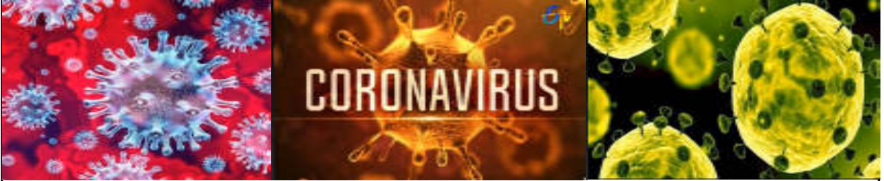
ప్రపంచాన్నే గడగడలాడిస్తున్న కరోణ వైరస్