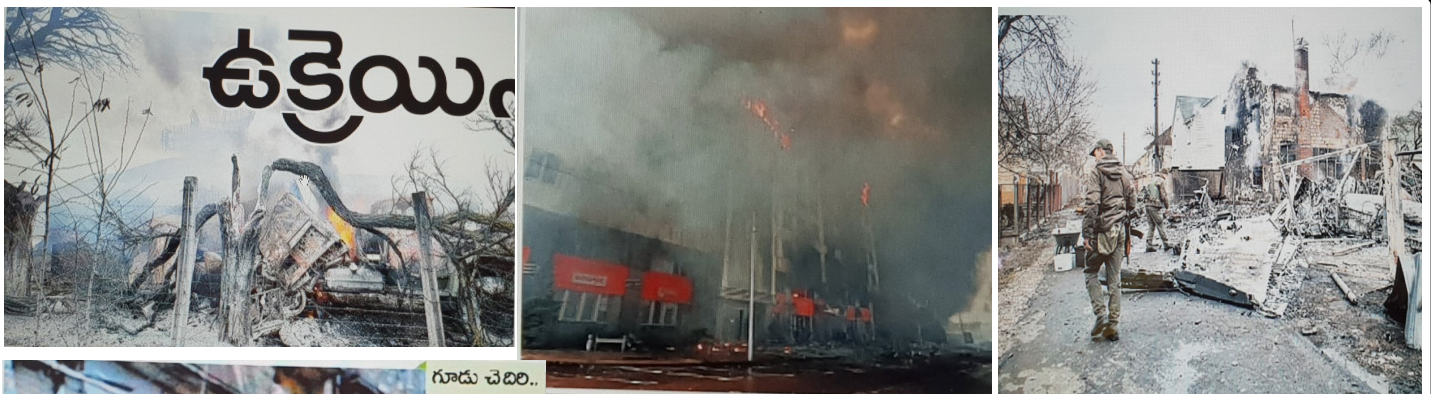
గూడు చెదిరి.. గుండె పగిలి..

సామ్రాజ్యవాద రష్యా మధ్య తీవ్రమవుతున్న ఉద్రిక్తలు ఎట్టకేలకు యుద్ధం రూపంలో బద్దలైనాయి. యుద్ధ పిపాసి అమెరికా రష్యాతో గతంలో కుదుర్చుకున్న పలు ఒప్పందాలను బుట్టదాఖలా చేసూ