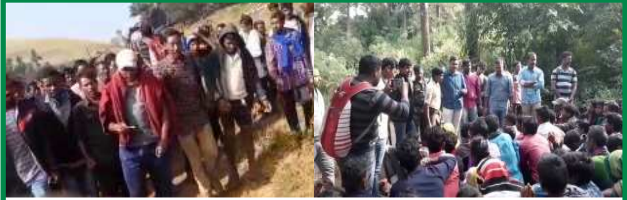
కూంబింగ్లు, అక్రమ అరెస్టులకు వ్యతిరేకంగా ర్యాలీ అనంతరం పోలీసు అధికారులను నిలదీస్తున్న ప్రజలు