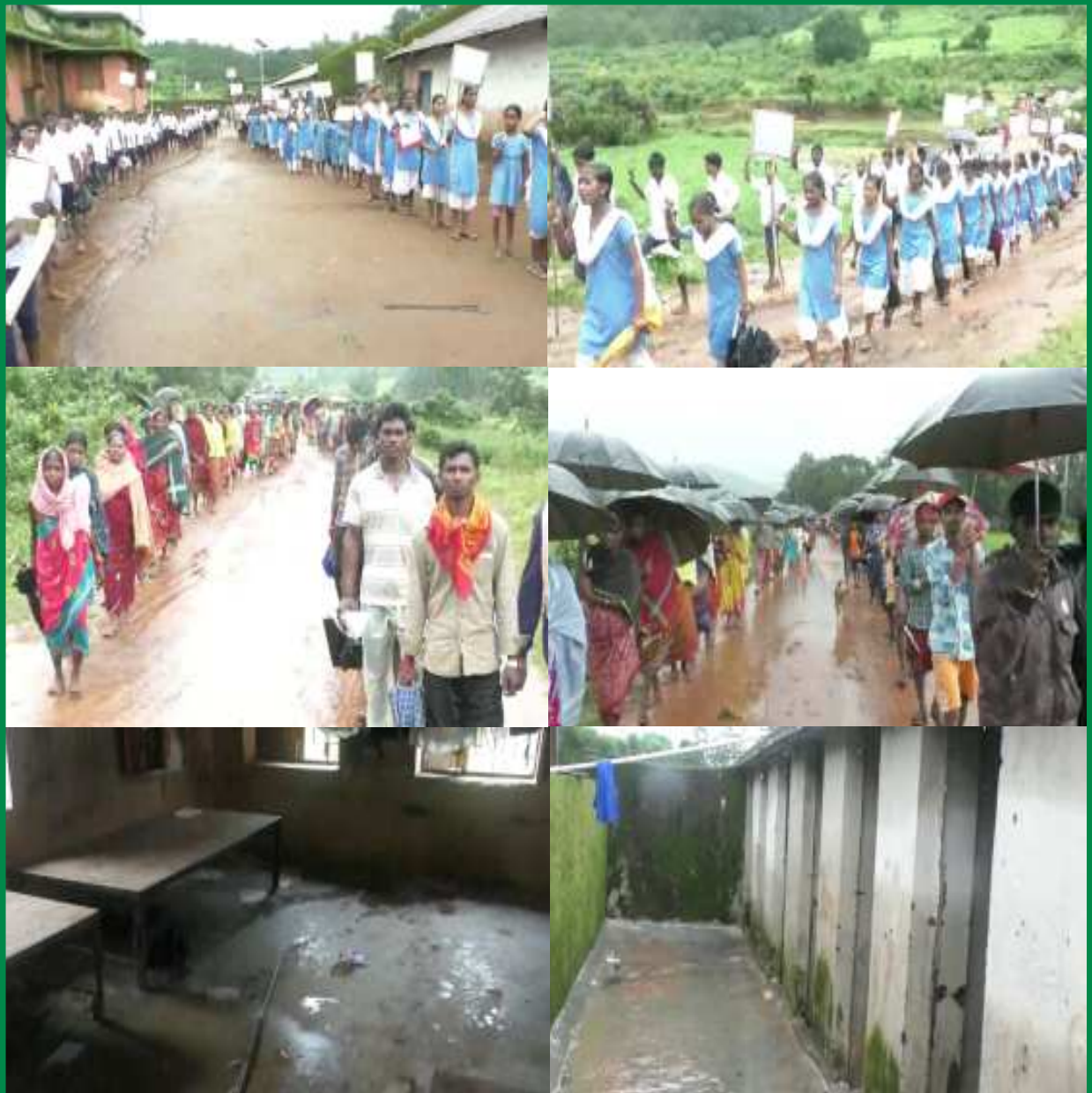
వర్షం సీటితో వసతి గృహాలు, పాకర పట్టిన బాత్ రూమ్లు... వగైరా సమస్యలతో పనసపూట్ పాఠశాల అందుకు ప్రభుత్వానికి వ్యతిరేకంగా ఆందోళన చేస్తున్న విద్యార్థులు, వారి తల్లిదండ్రులు