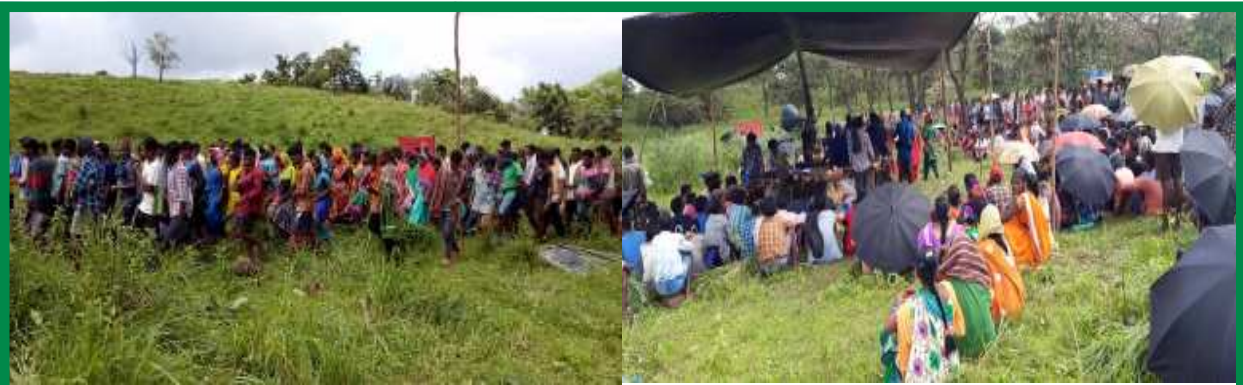
సెప్టెంబర్ 14 జతినదాస్ వర్ధంతి సందర్భంగా ర్యాళీ నిర్వహించి, సభ జరుపుకున్న పెదబయలు ఏరియా ప్రజలు

ప్రజాస్వామిక విప్లవంలో భాగంగా జరుగుతున్న ఆదివాసీ రైతాంగ ఉద్యమంపై అమలవుతున్న ఫాసిస్టు నిర్బంధకాండలో, అనేక మంది ఆదివాసీ రైతాంగ కర్షకర్షలు జైళ్ళలో మగ్గుతున్నారు. చివరికి బాక్సైట్ గనుల తవ్వకాన్ని ఆపేస్తున్నట్లుగా జగన్ ప్రకటించినప్పటికీ, బాక్సైట్ తవ్వకాల వ్యతిరేక పోరాటంలో కేసులు మోపబడిన అనేక మందిపై ఇప్పటికీ కేసులు ఎత్తివేయలేదు. కానీ చంద్రబాబు పాలనలో ప్రత్యేక హోదాకోసం జరిగిన ఉద్యమంలో తన పార్టీ (వై.ఎస్.ఆర్.సి.పి)కార్యకర్తలపై మోపిన కేసులను మాత్రం, జగన్ అధికారంలోకి రాగానే ఎత్తివేశాడు. ఈ పరిస్థితులలో, దేశంలో జరుగుతున్న ప్రజాస్వామిక విప్లవంలో భాగస్వాములవుతూ అరెస్టుయిన వారిని రాజకీయ ఖైదీలుగా గుర్తించాలనీ, వారిని వెంటనే విడుదల చేయాలని డిమాండ్ చేస్తూ, ప్రజాసభ జరిగింది.