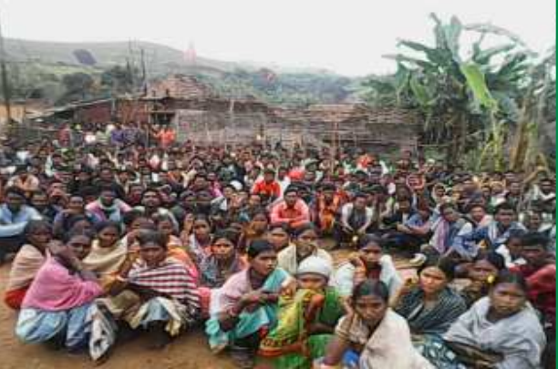
1. కూంబింగ్ లు ఆపేయాలంటూ కుంతిర్ పాడూర్ క్యాంపు పోలీసులను నీలబిస్తున్న ప్రజలు 2. నూతన క్యాంపుకు వ్యతిరేకంగా ఒంతలగూడలో ప్రజాసభ