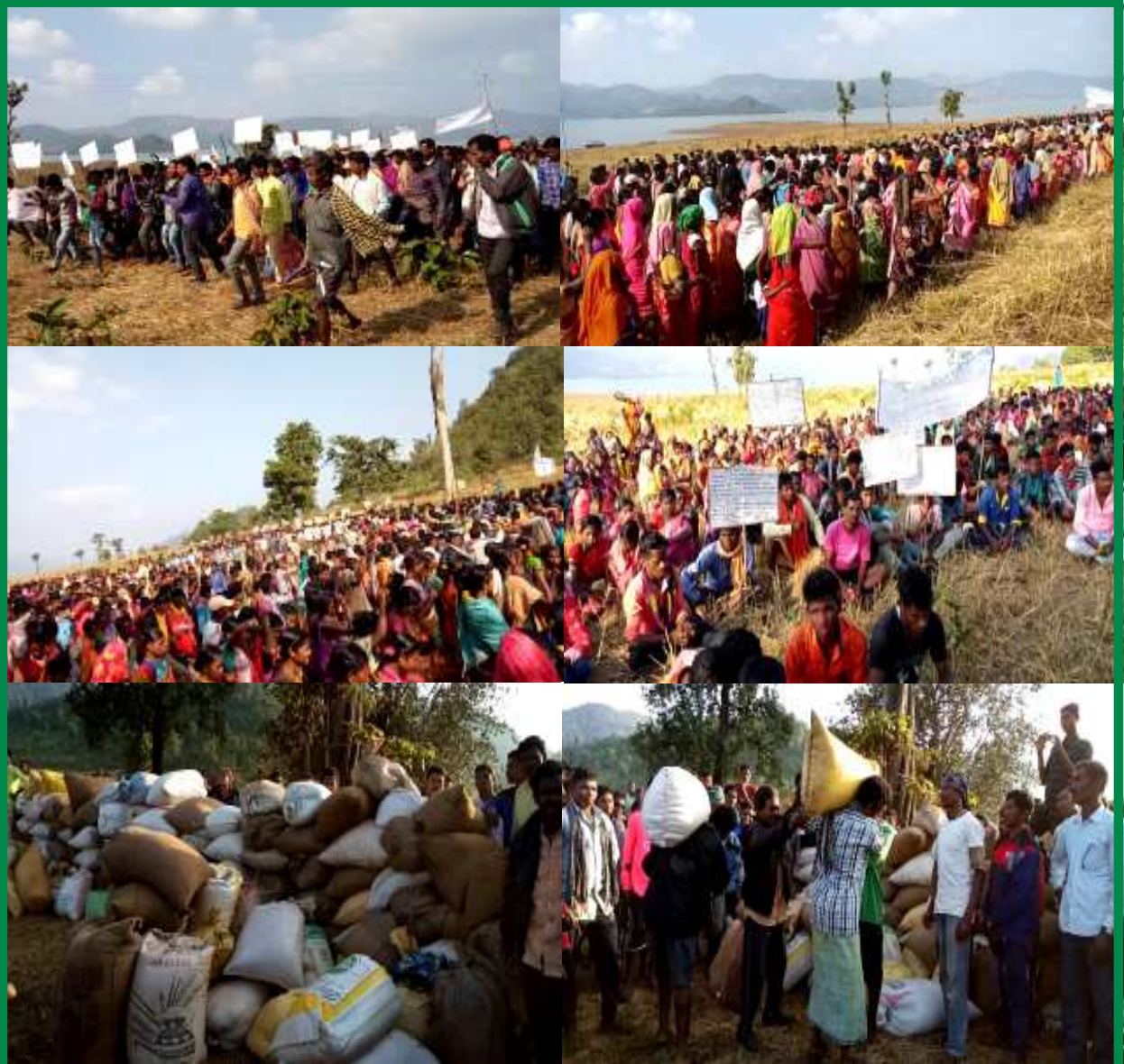
బలిమెల డ్యాం ముంపుకు గురైన ప్రజలకు రివేల మందితో సభ జరిపి ఆర్థిక, హాల్డిక సహాయానందించిన ఎమ్.కె.బి విప్లవ ప్రజాసేవ

స్పందించలేదు. ప్రజల డిమాండ్లను ఏ మాత్రం పట్టించుకోలేదు. దీంతో ఆ ప్రాంత ప్రజలు, ముఖ్యంగా ముంపుకు గురయిన పేద ఆదివాసీ రైతాంగాన్ని ఆదుకొనేందుకు ఒక సహాయక కమిటీని ఏర్పాటు చేశారు. ఈ కమిటీ ప్రభుత్వ నిర్లక్ష్య, ప్రజా వ్యతిరేక వైఖరిని నిరసిస్తూ, బాధిత ప్రజలను ఆదుకోవాలని వారం రోజులపాటు, ఆంధ్ర-ఒడిశాలోని సరిహద్దు గ్రామాలలో తిరిగి ప్రచారం చేశారు. ఈ పిలుపుకు ప్రజల నుండి గొప్ప స్పందన వచ్చింది. ఆంధ్రప్రదేశ్ లోని సరిహద్దు బూసిపుట్, జామ్ గూడ, వింజరి, కుమ్మ, బొంగపుట్, బరడా, లక్ష్మీపూర్ పంచాయతీలతో పాటు, కటాఫ్ ఏరియాలోని అనేక గ్రామాల ప్రజలు స్వచ్ఛందంగా ధాన్యం, రాగులు, బట్టలు, డబ్బులు తీసుకొని స్వయంగా తరలివచ్చి, ఒరపొదూర్ గ్రామంలో 7వేల మంది ప్రజలతో, ప్రభుత్వ ప్రజావ్యతిరేక వైఖరిని నిరసిస్తూ, ఊరేగింపు నిర్వహించి, భారీ బహిరంగ సభ జరిపారు. బాధిత గ్రామాల ప్రజలను పిలిచి అక్కడ జమచేసిన